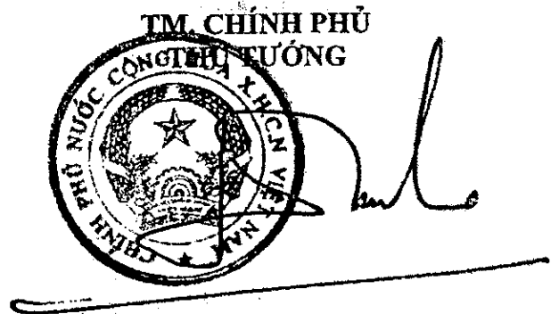
Nguyễn Tấn Dũng